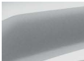
GRIS ECLAIR (2)