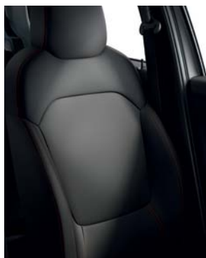
SELLERIE TEP NOIR AVEC SURPIQÛRES ORANGES