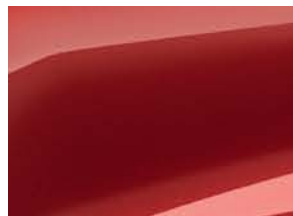
ROUGE GOJI (2)

(1) Teinte opaque. (2) Teinte métallisée.