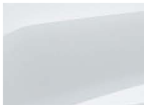
BLANC KAOLIN (1)