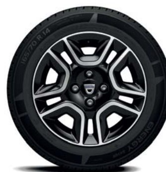
ENJOLIVEURS FLEXWHEEL DORIA 14"