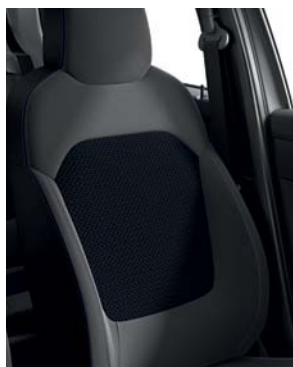
SELLERIE MIXTE TEP GRIS ET TISSU BLEU