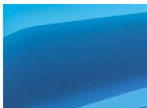
BLEU CENOTE (2)